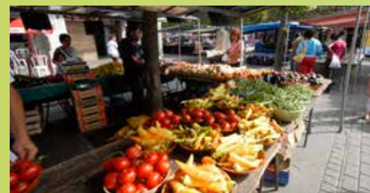
Marché de Moissy-Cramayel