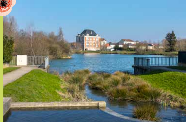
Bassin de la Rotonde-Allée de la Fraternité

Avec cette réalisation, l'Immobilière d'Île-de-France contribue au développement harmonieux de la ville tout en signant une nouvelle création urbaine de qualité.