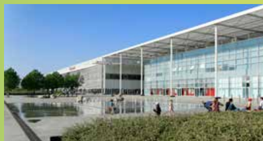
Centre commercial Carré Sénart