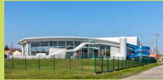
Centre Nautique Nympha