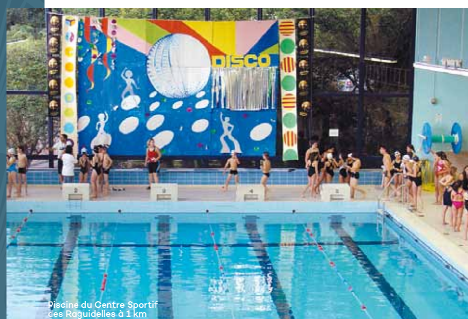
Piscine du Centre Sportif des Roguidelles à 1 km