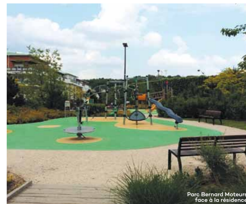
Parc Bernard Moteurs face à la résidence