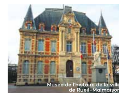
Musée de l'histoire de la ville de Rueil-Malmaison