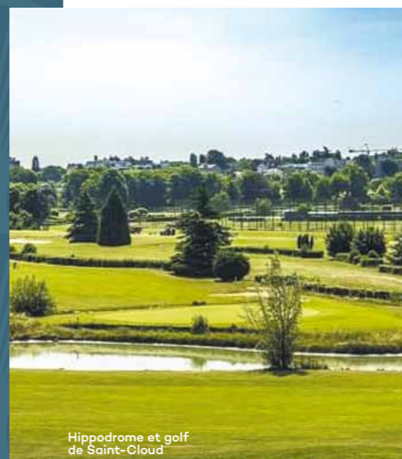
Hippodrome et golf de Saint-Cloud