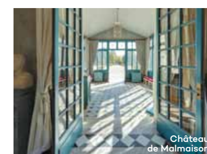
Château de Malmaison