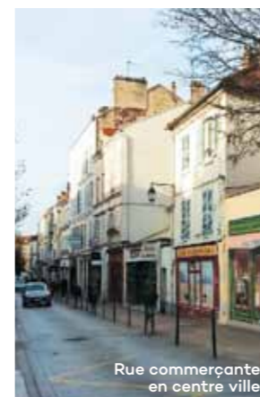
Rue commerçante en centre ville