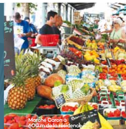
Marché Caron à 600 m de la résidence

Aussi, la gare Suresnes - Mont-Valérien, à 500 mètres du Clos des Fontaines , verra d'ici peu sa desserte en transports en commun facilitée et augmentée avec l'arrivée de la ligne 15 du Grand Paris Express. Cette dernière permettra de rejoindre La Défense en cinq minutes.