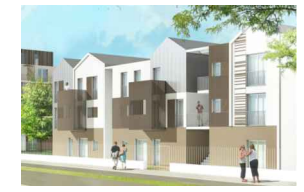
Bâtiments intermédiaires C et D

97 LOGEMENTS ZAC DE LA PEPINIERE - LOT E 93220 VILLEPINTE